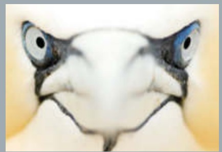
De Gent/Basstöpel Halunder/Helgoländisch

„Jarling“ ist Nordfriesisch und heißt „dieses Jahr“. JARLING, der Fotokalender aus Nordfriesland, spiegelt die Eigenart der Region nicht nur im Bild wider, sondern auch in den Sprachen Friesisch und Plattdeutsch. Zu jedem Bild erscheint der Text in einer dieser Sprachen; die deutschen Entsprechungen stehen auf diesem Blatt. Die Namen der Monate und Wochentage sind in den Dialekten der jeweiligen Bildunterschriften gehalten; zusätzlich werden auch die volkssprachlichen Bezeichnungen der Monate mit aufgeführt.